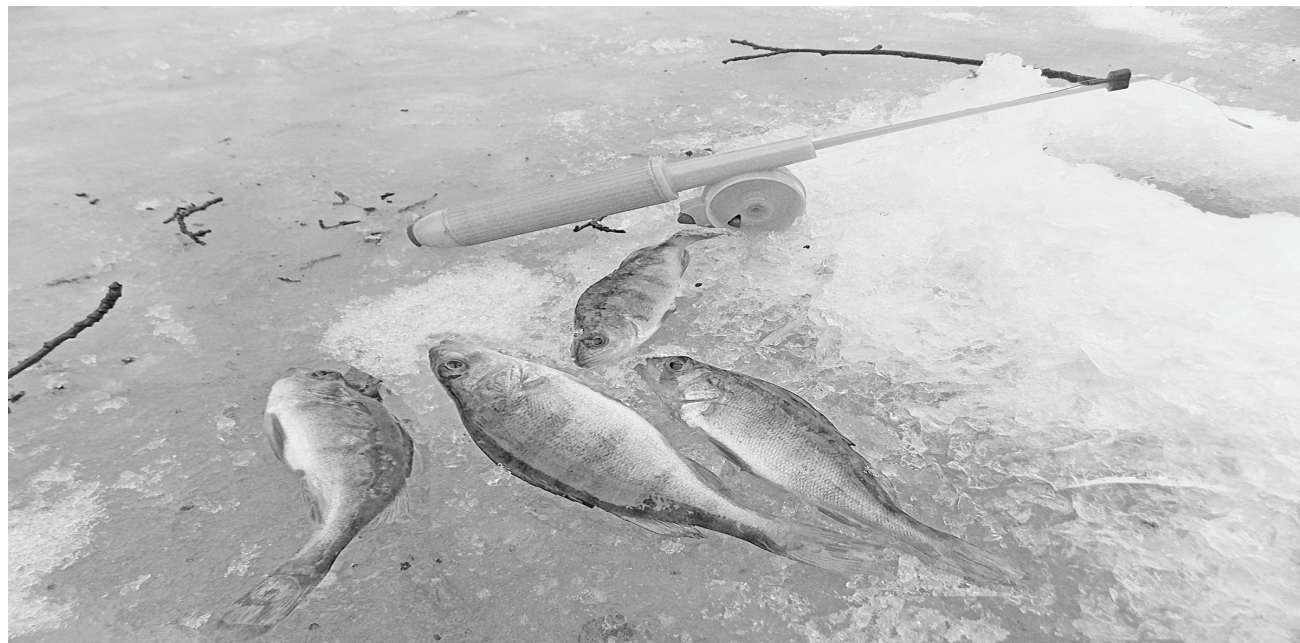
От редакции. События, описанные в рассказе, происходили зимой. Рыбалка на тонком весеннем льду опасна!