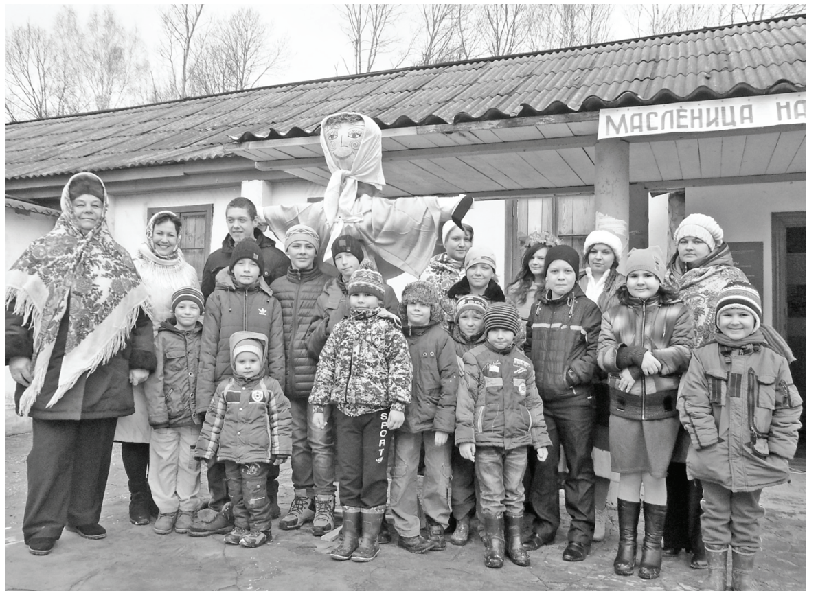
Масленица в Паликском СДК.