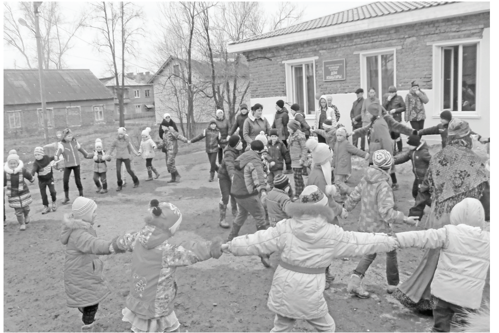
Хоровод в с.Паликский кирпичный завод.