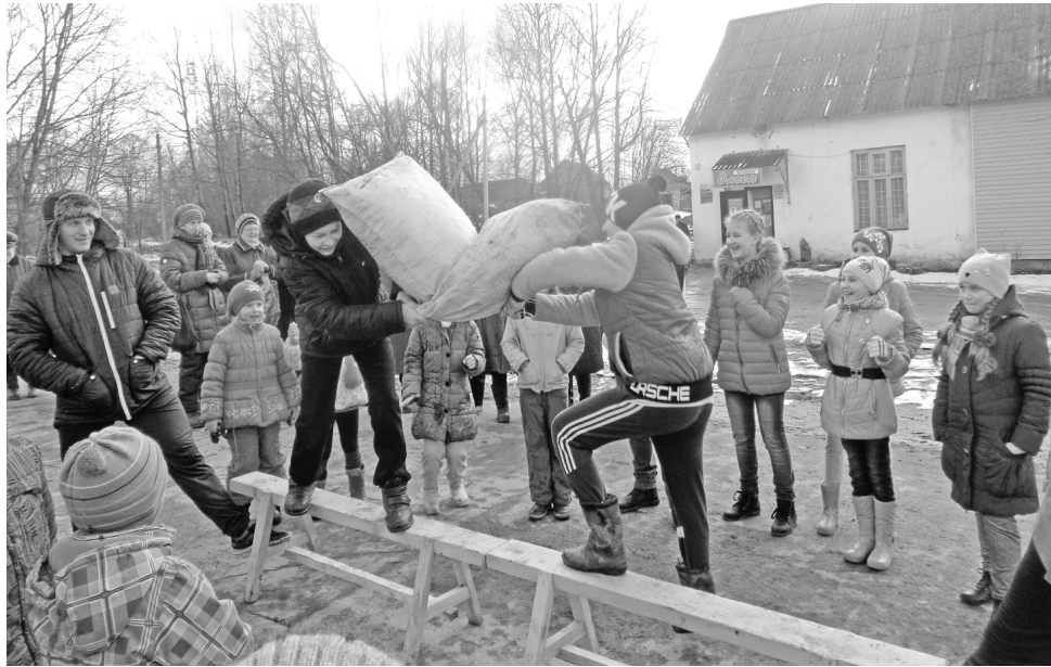
Шуточные бои в Брыни.

Продолжаем рассказ о том, как в Думиничском районе Весну встречали.